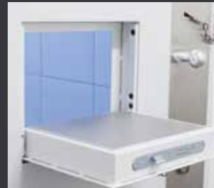
Auf der flächenbündigen Kommunikationsklappe können z.B. Tablets abgestellt oder Medikamente durchgereicht werden.