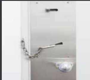
Schubriegel mit Sicherungskette verhindert plötzliches Aufstoßen der Tür aus der Zelle.