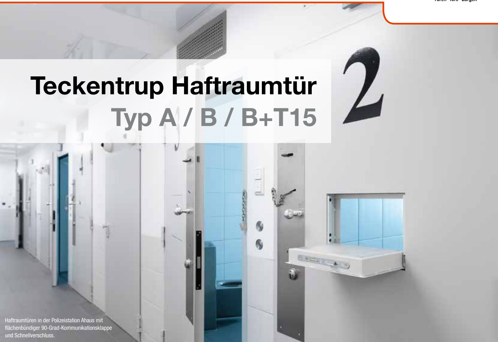
Haftraumtüren in der Polizeistation Ahaus mit flächenbündiger 90-Grad-Kommunikationsklappe und Schnellverschluss.