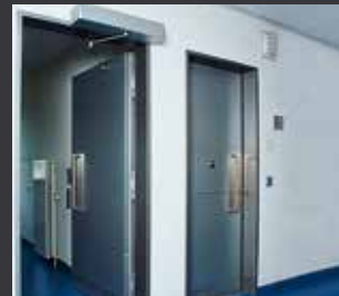
Haftraumtür in Behindertenzelle mit Drehflügelantrieb, automatisches Öffnen über einen Drucktaster und Schlüsseltaster.