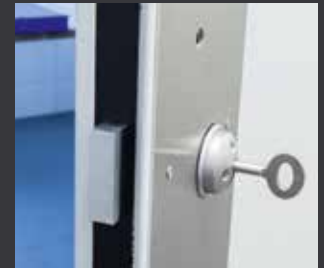
Sichere Verriegelung über spezielle Haftraumschlösser mit Einbart- oder Doppelpartschlüssel.