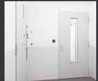
Verglaste Zugangstür (Sicherheitsklasse RC 3) zum Zellentrakt. Zusätzlich T30 feuerhemmend nach DIN 1634-1.